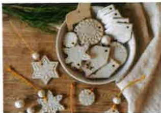
Schön verzierte Anhänger