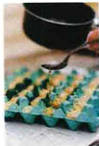
Grill & Kaminanzünder

Komm vorbei, eine Anmeldung braucht es nicht.