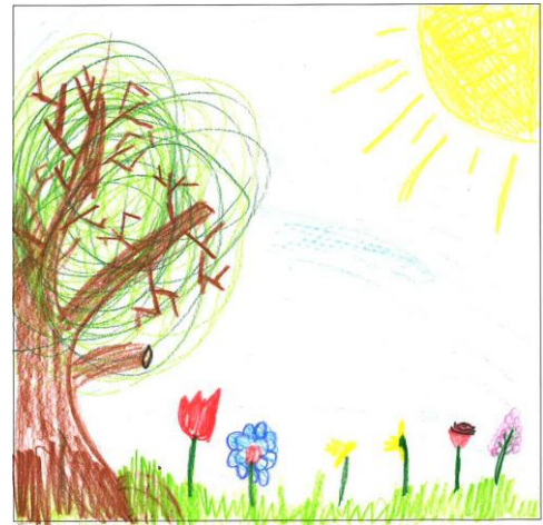
Gemalt von Asael Burgherr, 3. Kl.