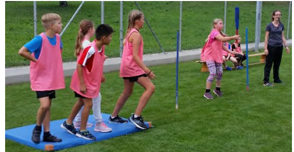
Am Nachmittag hatten alle viel Spass beim Spielen.