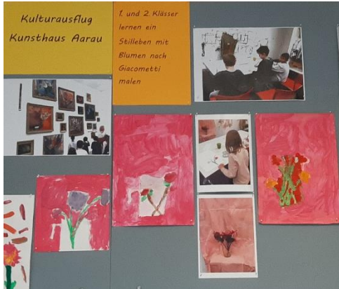
Im Foyer wurden die Kunstwerke der Klassen vom Ausflug ins Kunsthaus präsentiert.